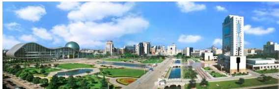
中共昆山市委员会 昆山市人民政府

在国家科技部、中国社科院城市创新能力综合测评中，昆山连续四年位居全国县级市第一，成为全国科技进步示范市，并连续七年被评为全国中小城市科学发展百强第一。