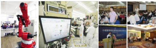
中共昆山市委员会 昆山市人民政府

涌现了小核酸领域的梁子才团队、OLED领域的邱勇团队、机器人领域的徐绪炯、张建伟团队等一批新人才引进新产业、新人才建设新城市的示范点，初步形成了引进一个领军人才、集聚一个创新团队、创办一个高科技企业、形成一个特色产业基地、发展壮大一个新兴产业的创新型经济发展新模式。