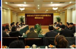
中共昆山市委 昆山市人民政府