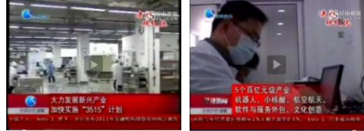
中共昆山市委员会 昆山市人民政府

昆山把发展战略性新兴产业作为主攻方向，大力实施“3515”计划，即打造3个千亿级产业、5个百亿级产业、15个百亿级企业。