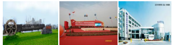
中共昆山市委 昆山市人民政府

特色产业基地 已成为昆山经济的重要增长极，新显示、可再生能源、新材料、生物医药、节能环保、服务外包，以及装备制造、软件、传感器和文化创意等特色产业基地加快建设，已逐步培育形成百亿元级乃至千亿元级产业集群。