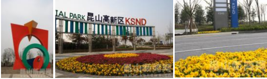
中共昆山市委 昆山市人民政府

昆山高新区 是新兴产业的试验区，已初步形成有机发光显示、模具、可再生能源三个产业集群，并积极培育机器人、小核酸产业，2010年成为全国县级第一个国家级高新技术产业开发区，去年又成为首批国家科技服务体系建设试点园区。