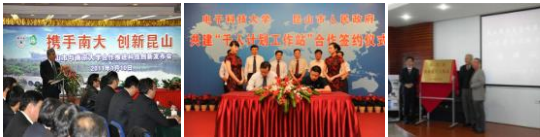
中共昆山市委 昆山市人民政府