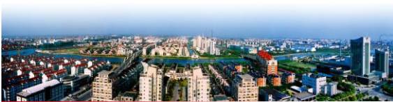
中共昆山市委 昆山市人民政府

近年来，昆山按照“新城市、新产业、新人才”的要求，充分发挥对台沿沪的独特优势，突出各类载体功能建设，推动重点园区的功能突破、资源整合和政策共享，以最优载体“抢最好的牌”，显著提升集聚整合发展要素的能力，努力使昆山成为产业资本和人才、技术、信息资源的汇聚地。