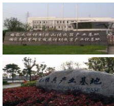
中共昆山市委 昆山市人民政府

光电产业园跻身首批国家新型工业化产业示范基地，吸引了总投资达200多亿元的20家企业落户，总投资33亿美元的TFT-LCD高世代平面显示项目建设进展顺利。