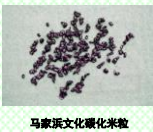
马家浜文化碳化米粒