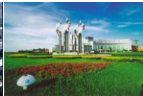
中共昆山市委 昆山市人民政府